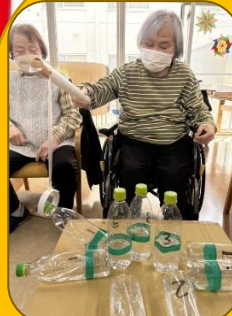
ペットボトル 立つん ですっ!