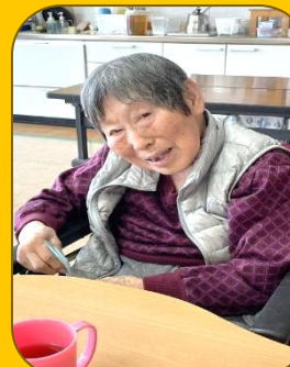
お喋りも楽しんで♪