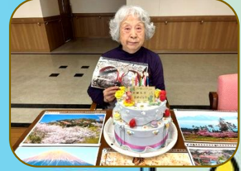
どこの名所でしょ?