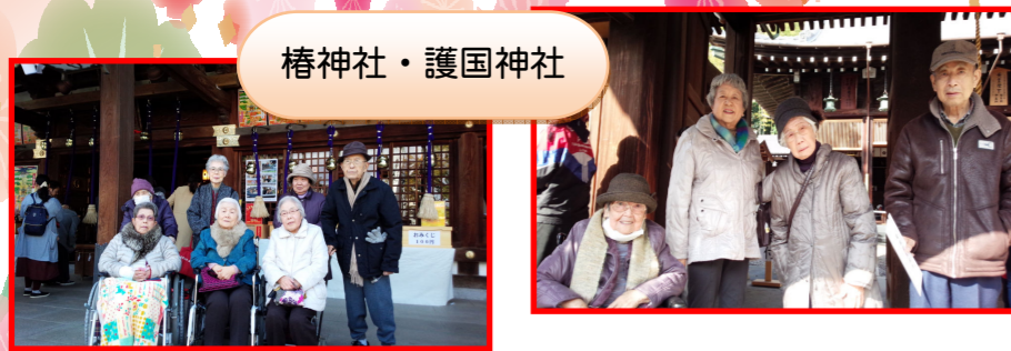
椿神社・護国神社

初詣で椿神社と護国神社へ行き、皆様の健康と幸せをお祈りしました。今年一年、皆様にとって素敵な一年になりますように!!